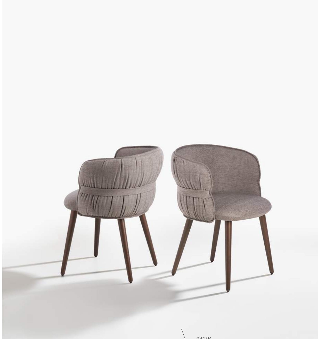
COULISSE 941/P poltrona | armchair